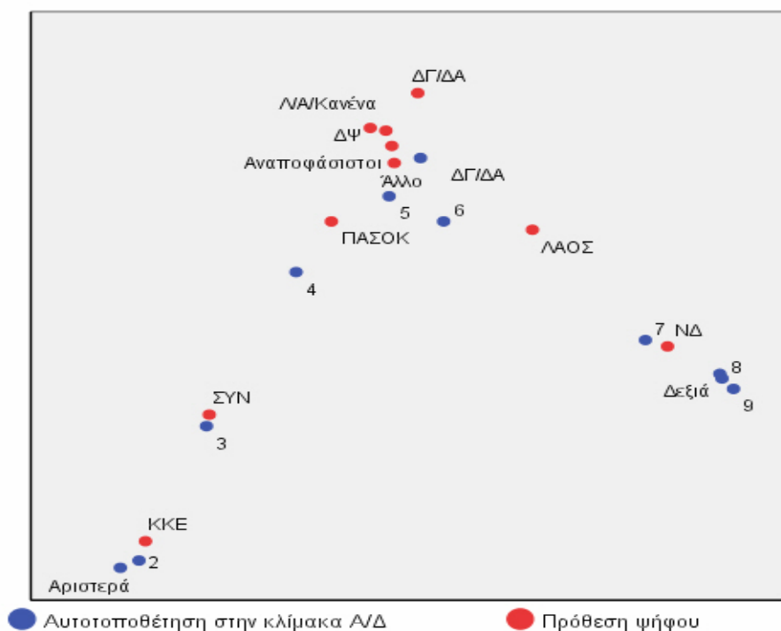
ΔΙΑΓΡΑΜΜΑ 5: Πρόθεση ψήφου και Αυτοτοποθέτηση στην κλίμακα Αριστερά / Δεξιά Ανάλυση αντιστοιχιών - Ιούνιος 2007

Αυτό που έμελλε να κριθεί στις εκλογές του Σεπτεμβρίου 2007 ήταν στην πραγματικότητα το ύψος της διαφοράς μεταξύ των δύο κομμάτων. Θα μπορούσαν συγκυριακοί παράγοντες, όπως, π.χ. οι πυρκαγιές του Αυγούστου, να μειώσουν τη διαφορά; Η δυναμική της προεκλογικής περιόδου, όπως αποτυπώνεται στα δύο Διαγράμματα που ακολουθούν, επιβεβαίωσε ότι το εκλογικό αποτέλεσμα κρίθηκε ολοκληρωτικά από τις «στρατηγικές τοποθετήσεις» των κομμάτων στον εκλογικό – πολιτικό ανταγωνισμό, ενώ οι δυναμικές της συγκυρίας, αν βεβαίως υπήρξαν, σε τελική ανάλυση δεν αλλοίωσαν τις γενικές τάσεις.